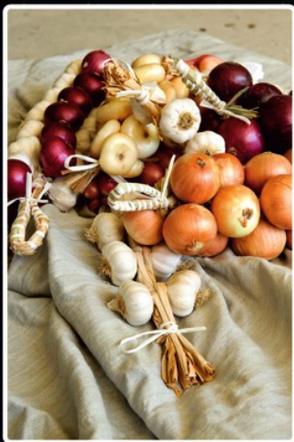
La cipolla di Cannara

Cannara - Passaggio di Bettona - Colle di Bettona - Torgiano - Miralduolo - Ferriera - Ponte Valleceppi - Bosco - Colombella Piccione - Pianello - S. Gregorio (Rifornimento) - Palazzo D'Assisi - Assisi - Santa Maria degli Angeli - direzione Foligno Cannara Totale Km 68