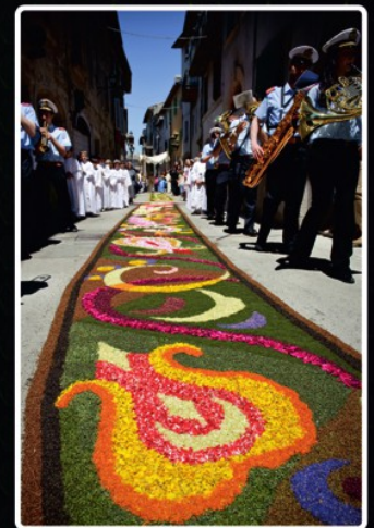
L'infiorata di Cannara