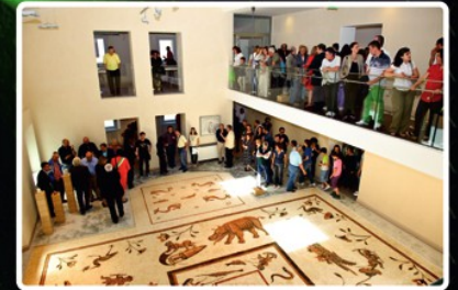
Museo Città di Cannara